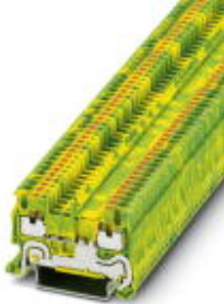
Schutzleiter-Reihenklemme, Anschlussart: Push-in-Anschluss, Querschnitt: 0,14 mm 2 - 1,5 mm 2 , AWG: 26 - 14, Breite: 3,5 mm, Höhe: 30,5 mm, Farbe: grün-gelb, Montageart: NS 35/7,5, NS 35/15

Bitte beachten Sie, dass die hier angegebenen Daten dem Online-Katalog entnommen sind. Die vollständigen Informationen und Daten entnehmen Sie bitte der Anwenderdokumentation. Es gelten die Allgemeinen Nutzungsbedingungen für Internet-Downloads. ( http://download.phoenixcontact.de )