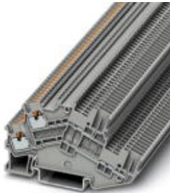
Mehrstock-Klemme, Querschnitt: 0,14 mm 2 - 1,5 mm 2 , AWG: 26 - 14, Anschlussart: Push-in-Anschluss, Breite: 3,5 mm, Farbe: grau, Montageart: NS 35/7,5, NS 35/15

Bitte beachten Sie, dass die hier angegebenen Daten dem Online-Katalog entnommen sind. Die vollständigen Informationen und Daten entnehmen Sie bitte der Anwenderdokumentation. Es gelten die Allgemeinen Nutzungsbedingungen für Internet-Downloads. ( http://download.phoenixcontact.de )