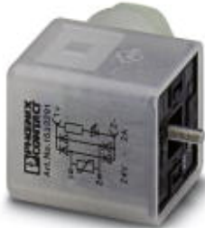
Ventilstecker, 3-polig, Bauform A, 1 LED, mit Schutzbeschaltung und Gleichrichter, Schraubanschluss, Kabelverschraubung Pg9

Bitte beachten Sie, dass die hier angegebenen Daten dem Online-Katalog entnommen sind. Die vollständigen Informationen und Daten entnehmen Sie bitte der Anwenderdokumentation. Es gelten die Allgemeinen Nutzungsbedingungen für Internet-Downloads. ( http://download.phoenixcontact.de )