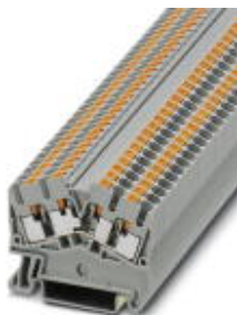
Durchgangsklemme, Anschlussart: Push-in-Anschluss, Querschnitt: 0,14 mm 2 - 4 mm 2 , AWG: 26 - 12, Breite: 5,2 mm, Farbe: grau, Montageart: NS 35/7,5, NS 35/15

Bitte beachten Sie, dass die hier angegebenen Daten dem Online-Katalog entnommen sind. Die vollständigen Informationen und Daten entnehmen Sie bitte der Anwenderdokumentation. Es gelten die Allgemeinen Nutzungsbedingungen für Internet-Downloads. ( http://download.phoenixcontact.de )