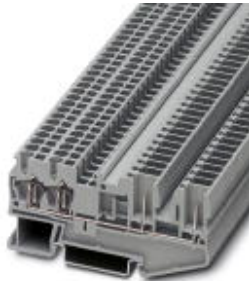
Durchgangsklemme, Anschlussart: Zugfeder- / Steckanschluss, Querschnitt: 0,08 mm 2 - 4 mm 2 , AWG: 28 - 12, Breite: 5,2 mm, Farbe: grau, Montageart: NS 35/7,5, NS 35/15

Bitte beachten Sie, dass die hier angegebenen Daten dem Online-Katalog entnommen sind. Die vollständigen Informationen und Daten entnehmen Sie bitte der Anwenderdokumentation. Es gelten die Allgemeinen Nutzungsbedingungen für Internet-Downloads. ( http://download.phoenixcontact.de )