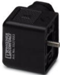
Ventilstecker, 4-polig, Bauform A, unbeschaltet, Schraubanschluss, Kabelverschraubung Pg9

Bitte beachten Sie, dass die hier angegebenen Daten dem Online-Katalog entnommen sind. Die vollständigen Informationen und Daten entnehmen Sie bitte der Anwenderdokumentation. Es gelten die Allgemeinen Nutzungsbedingungen für Internet-Downloads. ( http://download.phoenixcontact.de )