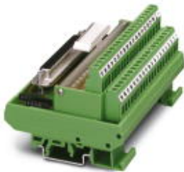
VARIOFACE-Modul, mit Schraubanschluss und D-Subminiatur-Buchsenleiste, zur Montage auf NS 35/7,5 oder NS 32, mit Leuchtanzeige, Polzahl 37

Bitte beachten Sie, dass die hier angegebenen Daten dem Online-Katalog entnommen sind. Die vollständigen Informationen und Daten entnehmen Sie bitte der Anwenderdokumentation. Es gelten die Allgemeinen Nutzungsbedingungen für Internet-Downloads. ( http://download.phoenixcontact.de )