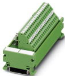
VARIOFACE-Modul, mit Zugfederanschluss und D-Subminiatur-Buchsenleiste, zur Montage auf NS 35/7,5, Polzahl 37

Bitte beachten Sie, dass die hier angegebenen Daten dem Online-Katalog entnommen sind. Die vollständigen Informationen und Daten entnehmen Sie bitte der Anwenderdokumentation. Es gelten die Allgemeinen Nutzungsbedingungen für Internet-Downloads. ( http://download.phoenixcontact.de )