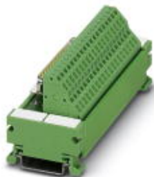
VARIOFACE-Modul, mit Zugfederanschluss und D-Subminiatur-Stiftleiste, zur Montage auf NS 35/7,5, Polzahl 50

Bitte beachten Sie, dass die hier angegebenen Daten dem Online-Katalog entnommen sind. Die vollständigen Informationen und Daten entnehmen Sie bitte der Anwenderdokumentation. Es gelten die Allgemeinen Nutzungsbedingungen für Internet-Downloads. ( http://download.phoenixcontact.de )