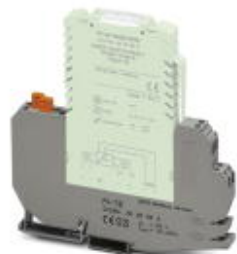
Grundklemme für nicht eigensichere Signale, mit Messertrennung und Prüfabgriffen.

Bitte beachten Sie, dass die hier angegebenen Daten dem Online-Katalog entnommen sind. Die vollständigen Informationen und Daten entnehmen Sie bitte der Anwenderdokumentation. Es gelten die Allgemeinen Nutzungsbedingungen für Internet-Downloads. ( http://download.phoenixcontact.de )