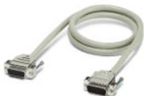
Konfektioniertes, geschirmtes Rundkabel, mit 25-poliger D SUB Buchsen- und Stiftleiste, Kabellänge: 2 m

Bitte beachten Sie, dass die hier angegebenen Daten dem Online-Katalog entnommen sind. Die vollständigen Informationen und Daten entnehmen Sie bitte der Anwenderdokumentation. Es gelten die Allgemeinen Nutzungsbedingungen für Internet-Downloads. ( http://download.phoenixcontact.de )