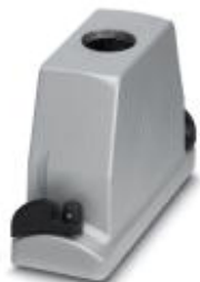
HEAVYCON ADVANCE EMV Tüllengehäuse B16, mit Bajonettverriegelung, Höhe 100 mm, mit Gewinde 1x M40, geradem Kabelabgang

Bitte beachten Sie, dass die hier angegebenen Daten dem Online-Katalog entnommen sind. Die vollständigen Informationen und Daten entnehmen Sie bitte der Anwenderdokumentation. Es gelten die Allgemeinen Nutzungsbedingungen für Internet-Downloads. ( http://download.phoenixcontact.de )