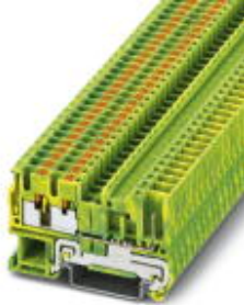
Schutzleiter-Reihenklemme, Anschlussart: Push-in- / Steckanschluss, Querschnitt: 0,14 mm 2 - 4 mm 2 , AWG: 26 - 12, Breite: 5,2 mm, Höhe: 35,2 mm, Farbe: grün-gelb, Montageart: NS 35/7,5, NS 35/15

Bitte beachten Sie, dass die hier angegebenen Daten dem Online-Katalog entnommen sind. Die vollständigen Informationen und Daten entnehmen Sie bitte der Anwenderdokumentation. Es gelten die Allgemeinen Nutzungsbedingungen für Internet-Downloads. ( http://download.phoenixcontact.de )