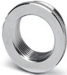
Reduzieradapter, M25 auf M20, inklusive O-Ring

Bitte beachten Sie, dass die hier angegebenen Daten dem Online-Katalog entnommen sind. Die vollständigen Informationen und Daten entnehmen Sie bitte der Anwenderdokumentation. Es gelten die Allgemeinen Nutzungsbedingungen für Internet-Downloads. ( http://download.phoenixcontact.de )