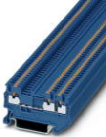
Durchgangsklemme, Anschlussart: Push-in-Anschluss, Querschnitt: 0,14 mm 2 - 1,5 mm 2 , AWG: 26 - 14, Breite: 3,5 mm, Höhe: 30,5 mm, Farbe: blau, Montageart: NS 35/7,5, NS 35/15

Bitte beachten Sie, dass die hier angegebenen Daten dem Online-Katalog entnommen sind. Die vollständigen Informationen und Daten entnehmen Sie bitte der Anwenderdokumentation. Es gelten die Allgemeinen Nutzungsbedingungen für Internet-Downloads. ( http://download.phoenixcontact.de )