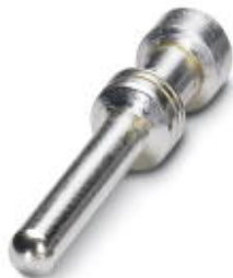
Gedrehter 2,5er Crimpkontakt, Stift-Einzelkontakt, Aderquerschnitt 0,5 mm 2 , versilbert

Bitte beachten Sie, dass die hier angegebenen Daten dem Online-Katalog entnommen sind. Die vollständigen Informationen und Daten entnehmen Sie bitte der Anwenderdokumentation. Es gelten die Allgemeinen Nutzungsbedingungen für Internet-Downloads. ( http://download.phoenixcontact.de )