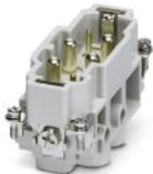
HEAVYCON Steckereinsatz, Serie K4/2, für 4 Leistungs- und 2 Steuerkontakte, Schraubanschluss, Produkt mit Hartinglogo

Bitte beachten Sie, dass die hier angegebenen Daten dem Online-Katalog entnommen sind. Die vollständigen Informationen und Daten entnehmen Sie bitte der Anwenderdokumentation. Es gelten die Allgemeinen Nutzungsbedingungen für Internet-Downloads. ( http://download.phoenixcontact.de )