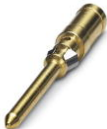
Gedrehter 1,6er Crimpkontakt, Stift-Einzelkontakt, Aderquerschnitt 2,5 mm 2 , vergoldet

Bitte beachten Sie, dass die hier angegebenen Daten dem Online-Katalog entnommen sind. Die vollständigen Informationen und Daten entnehmen Sie bitte der Anwenderdokumentation. Es gelten die Allgemeinen Nutzungsbedingungen für Internet-Downloads. ( http://download.phoenixcontact.de )