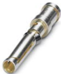
Gedrehter 1,6er Crimpkontakt, Buchsen-Einzelkontakt, Aderquerschnitt 0,5 mm 2 , versilbert

Bitte beachten Sie, dass die hier angegebenen Daten dem Online-Katalog entnommen sind. Die vollständigen Informationen und Daten entnehmen Sie bitte der Anwenderdokumentation. Es gelten die Allgemeinen Nutzungsbedingungen für Internet-Downloads. ( http://download.phoenixcontact.de )