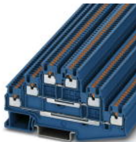
Mehrstock-Klemme, Querschnitt: 0,14 mm 2 - 1,5 mm 2 , AWG: 26 - 16, Anschlussart: Push-in-Anschluss, Breite: 3,5 mm, Farbe: blau, Montageart: NS 35/7,5, NS 35/15

Bitte beachten Sie, dass die hier angegebenen Daten dem Online-Katalog entnommen sind. Die vollständigen Informationen und Daten entnehmen Sie bitte der Anwenderdokumentation. Es gelten die Allgemeinen Nutzungsbedingungen für Internet-Downloads. ( http://download.phoenixcontact.de )