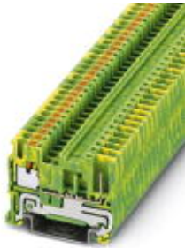
Schutzleiter-Reihenklemme, Anschlussart: Push-in- / Steckanschluss, Querschnitt: 0,14 mm 2 - 4 mm 2 , AWG: 26 - 12, Breite: 5,2 mm, Höhe: 35,3 mm, Farbe: grün-gelb, Montageart: NS 35/7,5, NS 35/15

Bitte beachten Sie, dass die hier angegebenen Daten dem Online-Katalog entnommen sind. Die vollständigen Informationen und Daten entnehmen Sie bitte der Anwenderdokumentation. Es gelten die Allgemeinen Nutzungsbedingungen für Internet-Downloads. ( http://download.phoenixcontact.de )