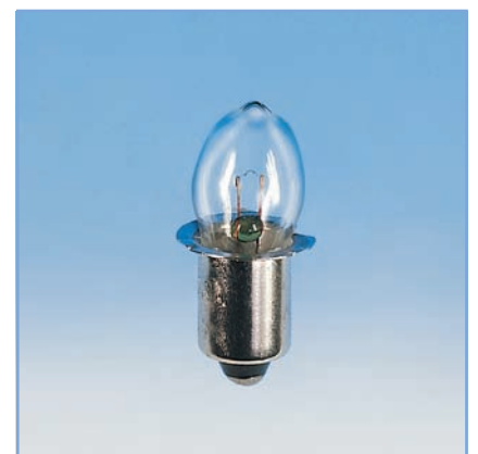
VPE 10 Stück