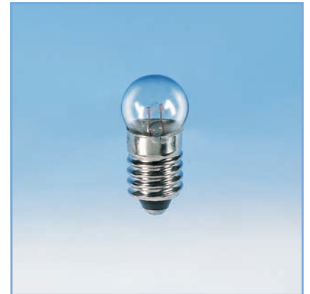
VPE 10 Stück