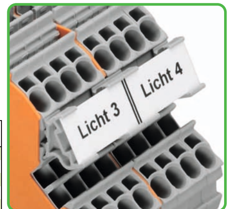
Adapter für Beschriftungsstreifen in die seitliche Beschriftungsaufnahme einsetzbar