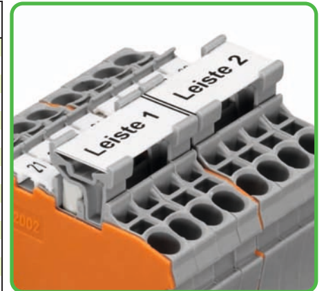
Adapter für Beschriftungsstreifen in Brückeöffnungen einsetzbar