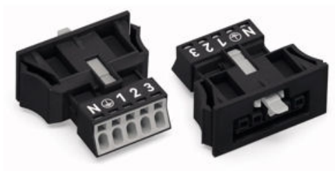
Verpackungseinheit 50 Stück

Bestellnummer: 890-705 Produktbeschreibung: Buchse Snap-In-Ausführung 5-polig CAGE CLAMP®S-Anschluss