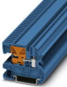
N-Trennklemme, Schraubanschluss, Querschnitt: 0,14 mm 2 - 4 mm 2 , AWG: 26 - 12, Breite: 5,2 mm, Farbe: blau, Montageart: NS 35/7,5, NS 35/15

Bitte beachten Sie, dass die hier angegebenen Daten dem Online-Katalog entnommen sind. Die vollständigen Informationen und Daten entnehmen Sie bitte der Anwenderdokumentation. Es gelten die Allgemeinen Nutzungsbedingungen für Internet-Downloads. ( http://download.phoenixcontact.de )