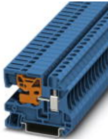
N-Trennklemme, Schraubanschluss, Querschnitt: 0,2 mm 2 - 10 mm 2 , AWG: 24 - 8, Breite: 8,2 mm, Farbe: blau, Montageart: NS 35/7,5, NS 35/15

Bitte beachten Sie, dass die hier angegebenen Daten dem Online-Katalog entnommen sind. Die vollständigen Informationen und Daten entnehmen Sie bitte der Anwenderdokumentation. Es gelten die Allgemeinen Nutzungsbedingungen für Internet-Downloads. ( http://download.phoenixcontact.de )