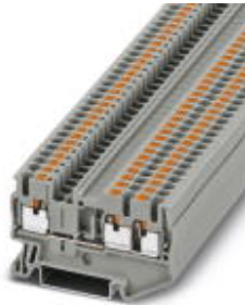
Durchgangsklemme, Anschlussart: Push-in-Anschluss, Querschnitt: 0,14 mm 2 - 4 mm 2 , AWG: 26 - 12, Breite: 5,2 mm, Höhe: 35,2 mm, Farbe: grau, Montageart: NS 35/7,5, NS 35/15

Bitte beachten Sie, dass die hier angegebenen Daten dem Online-Katalog entnommen sind. Die vollständigen Informationen und Daten entnehmen Sie bitte der Anwenderdokumentation. Es gelten die Allgemeinen Nutzungsbedingungen für Internet-Downloads. ( http://download.phoenixcontact.de )