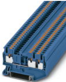
Durchgangsklemme, Anschlussart: Push-in-Anschluss, Querschnitt: 0,14 mm 2 - 4 mm 2 , AWG: 26 - 12, Breite: 5,2 mm, Höhe: 35,2 mm, Farbe: blau, Montageart: NS 35/7,5, NS 35/15

Bitte beachten Sie, dass die hier angegebenen Daten dem Online-Katalog entnommen sind. Die vollständigen Informationen und Daten entnehmen Sie bitte der Anwenderdokumentation. Es gelten die Allgemeinen Nutzungsbedingungen für Internet-Downloads. ( http://download.phoenixcontact.de )