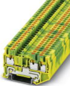
Schutzleiter-Reihenklemme, Anschlussart: Push-in-Anschluss, Querschnitt: 0,14 mm 2 - 4 mm 2 , AWG: 26 - 12, Breite: 5,2 mm, Höhe: 35,2 mm, Farbe: grün-gelb, Montageart: NS 35/7,5, NS 35/15

Bitte beachten Sie, dass die hier angegebenen Daten dem Online-Katalog entnommen sind. Die vollständigen Informationen und Daten entnehmen Sie bitte der Anwenderdokumentation. Es gelten die Allgemeinen Nutzungsbedingungen für Internet-Downloads. ( http://download.phoenixcontact.de )