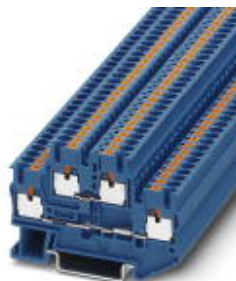
Doppelstock-Klemme, Querschnitt: 0,14 mm 2 - 4 mm 2 , AWG: 26 - 12, Anschlussart: Push-in-Anschluss, Breite: 5,2 mm, Farbe: blau, Montageart: NS 35/7,5, NS 35/15

Bitte beachten Sie, dass die hier angegebenen Daten dem Online-Katalog entnommen sind. Die vollständigen Informationen und Daten entnehmen Sie bitte der Anwenderdokumentation. Es gelten die Allgemeinen Nutzungsbedingungen für Internet-Downloads. ( http://download.phoenixcontact.de )