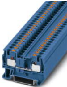
Durchgangsklemme, Anschlussart: Push-in-Anschluss, Querschnitt: 0,2 mm 2 - 6 mm 2 , AWG: 24 - 10, Breite: 6,2 mm, Höhe: 35,3 mm, Farbe: blau, Montageart: NS 35/7,5, NS 35/15

Bitte beachten Sie, dass die hier angegebenen Daten dem Online-Katalog entnommen sind. Die vollständigen Informationen und Daten entnehmen Sie bitte der Anwenderdokumentation. Es gelten die Allgemeinen Nutzungsbedingungen für Internet-Downloads. ( http://download.phoenixcontact.de )