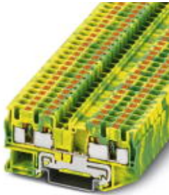
Schutzleiter-Reihenklemme, Anschlussart: Push-in-Anschluss, Querschnitt: 0,2 mm 2 - 6 mm 2 , AWG: 24 - 10, Breite: 6,2 mm, Höhe: 35,3 mm, Farbe: grün-gelb, Montageart: NS 35/7,5, NS 35/15

Bitte beachten Sie, dass die hier angegebenen Daten dem Online-Katalog entnommen sind. Die vollständigen Informationen und Daten entnehmen Sie bitte der Anwenderdokumentation. Es gelten die Allgemeinen Nutzungsbedingungen für Internet-Downloads. ( http://download.phoenixcontact.de )