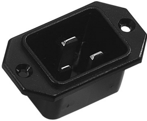
Einbau - Gerätestecker, 16A mit Längsflansch. Alte K+B Serie 751