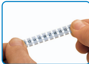
Strecken eines Streifens, dehnbar von 4 mm bis 4,2 mm dehnbar von 5 mm bis 5,2 mm