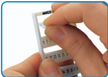
Lösen eines Streifens aus der WMB-Bezeichnungskarte