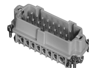
Abbildung stellvertretend für alle verfügbaren Polzahlen.

Unterserie Schwere Steckverbinder C 146 E