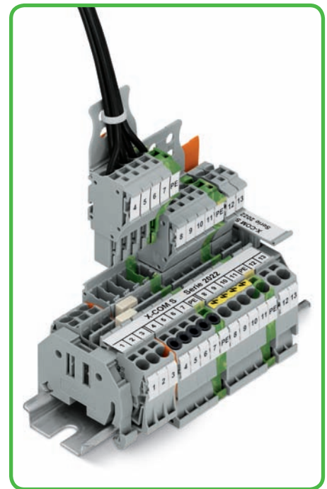
Federleisten mit CAGE CLAMP®-S-Anschluss siehe Seite 52