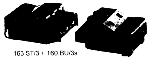
163 ST/3 + 160 BU/3s mit ZEL und ABK