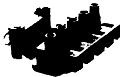
160 BU/5s mit ZEL