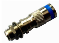
in Verbindung mit Befestigungsset BFS-FB03 auch direkt auf Erdungsschienen montierbar