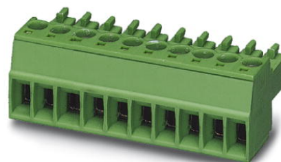
Abbildung zeigt eine 10-polige Variante des Artikels

http://eshop.phoenixcontact.de/phoenix/treeViewClick.do?UID=1840382