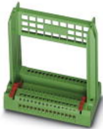
Steckkartenblock, Nennstrom: 5 A, Polzahl: 31, Rastermaß: 5 mm, Anschlussart: Schraubanschluss, Farbe: grün

Bitte beachten Sie, dass die hier angegebenen Daten dem Online-Katalog entnommen sind. Die vollständigen Informationen und Daten entnehmen Sie bitte der Anwenderdokumentation. Es gelten die Allgemeinen Nutzungsbedingungen für Internet-Downloads. ( http://download.phoenixcontact.de )