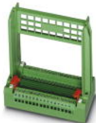
Steckkartenblock, Nennstrom: 1 A, Polzahl: 32, Rastermaß: 5,08 mm, Anschlussart: Schraubanschluss, Farbe: grün

Bitte beachten Sie, dass die hier angegebenen Daten dem Online-Katalog entnommen sind. Die vollständigen Informationen und Daten entnehmen Sie bitte der Anwenderdokumentation. Es gelten die Allgemeinen Nutzungsbedingungen für Internet-Downloads. ( http://download.phoenixcontact.de )