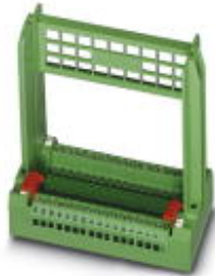
Steckkartenblock, Nennstrom: 4 A, Polzahl: 32, Rastermaß: 5,08 mm, Anschlussart: Schraubanschluss, Farbe: grün

Bitte beachten Sie, dass die hier angegebenen Daten dem Online-Katalog entnommen sind. Die vollständigen Informationen und Daten entnehmen Sie bitte der Anwenderdokumentation. Es gelten die Allgemeinen Nutzungsbedingungen für Internet-Downloads. ( http://download.phoenixcontact.de )