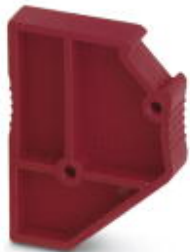
Distanzplatte, Farbe: rot

Bitte beachten Sie, dass die hier angegebenen Daten dem Online-Katalog entnommen sind. Die vollständigen Informationen und Daten entnehmen Sie bitte der Anwenderdokumentation. Es gelten die Allgemeinen Nutzungsbedingungen für Internet-Downloads. ( http://download.phoenixcontact.de )