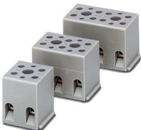
Abbildung zeigt eine Kombination aus den Varianten G 5/2, G 5/3 und G 5/4

Geräteklemme, zur Direktmontage, Polzahl 4