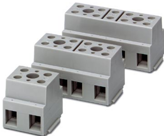
Abbildung zeigt eine Kombination aus den Varianten G 10/2, G 10/4 und G 10/5

Geräteklemme, zur Direktmontage, Polzahl 3