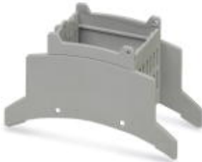
Oberteil für Installationsgehäuse BC, Breite: 35,6 mm, Anschlussraumtiefe: 22 mm

Bitte beachten Sie, dass die hier angegebenen Daten dem Online-Katalog entnommen sind. Die vollständigen Informationen und Daten entnehmen Sie bitte der Anwenderdokumentation. Es gelten die Allgemeinen Nutzungsbedingungen für Internet-Downloads. ( http://download.phoenixcontact.de )