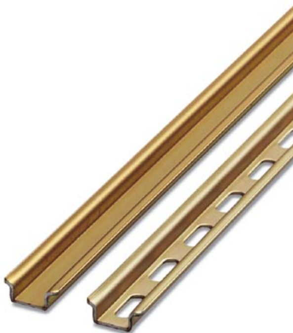
Abbildung zeigt die Variante NS 15 in der Ausführung gelocht und ungelocht

Hutprofil-Tragschiene, Material: Stahl, ungelocht, Höhe 5,5 mm, Breite 15 mm, Länge: 2 m