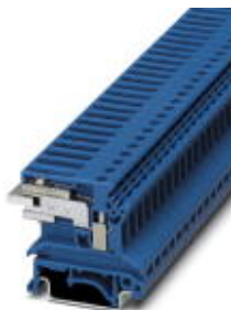
N-Trennklemme, Spezial- und Mischanschluss, Querschnitt: 0,2 mm 2 - 4 mm 2 , AWG: 24 - 12, Breite: 6,2 mm, Farbe: blau, Montageart: NS 35/7,5, NS 35/15, NS 32

Bitte beachten Sie, dass die hier angegebenen Daten dem Online-Katalog entnommen sind. Die vollständigen Informationen und Daten entnehmen Sie bitte der Anwenderdokumentation. Es gelten die Allgemeinen Nutzungsbedingungen für Internet-Downloads. ( http://download.phoenixcontact.de )