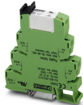
Abbildung zeigt die Variante PLC-RSC- 24DC/21-21

http://eshop.phoenixcontact.de/phoenix/treeViewClick.do?UID=2967099