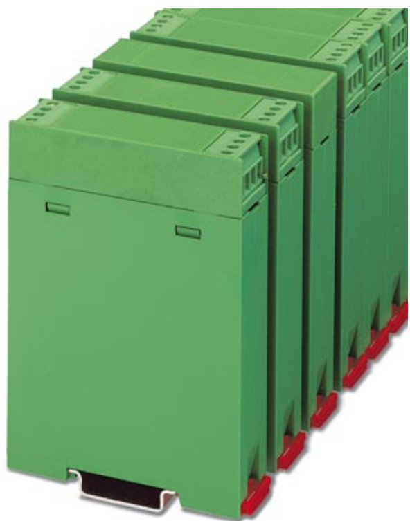
Gehäuse-Abdeckung, für zweiseitigen Anschluss

Abbildung zeigt eine vollständig montierte Variante des Elektronikgehäuses